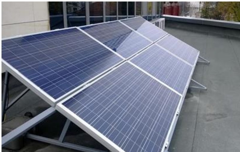
Фиг. 1. Фотоволтаична централа на покрива на БСУ.

Изследването се проведе при използване на изградената фотоволтаична централа на покрива на БСУ и специално разработена за целта метеорологична станция (BFU-METEO - система за мониторинг на параметрите на слънчевата радиация, температурата и вятъра). BFU-METEO дава възможност да се получават данни за параметрите на околната среда в реално време през пет минути [2-4, 10].